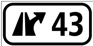
4.59 Tavoletta numerata per raccordi (art. 56)