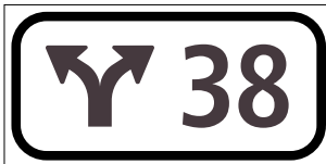
4.59.1 Tavoletta numerata per ramifica- zioni (art.56)